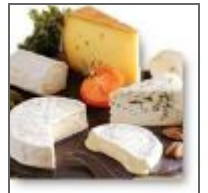
Planche de fromage du terroir en pointe accompagnée de fruits frais

Fresque décorative de crudités du jardin & sa sélection de trempette