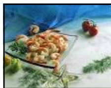
Cocktail de crevettes