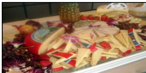
Miroir de fromages à saveur locale et son accompagnement de fruits frais taillés