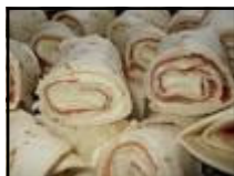
Enroulés de pita aux viandes froides