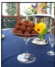
Truffes à l'inspiration du moment