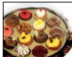
Miroir de mignardises