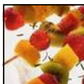
Brochettes de fruits