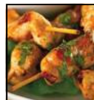
Cubes de poulet miniatures en broche