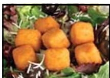
Cubes miniatures de parmesan au goût du chef