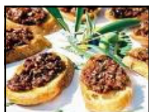
Craquelins à la tapenade surprise