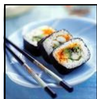
Assortiment de sushis