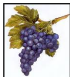
Plateau de raisins & fromages