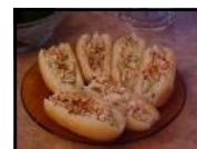
Tortillas roulées au jambon & fromage